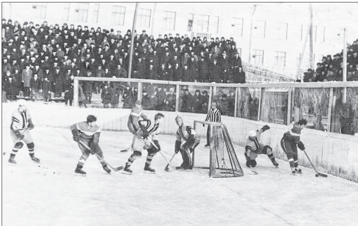
«Водник» играет в Тюмени. Вторая половина 1960-х.