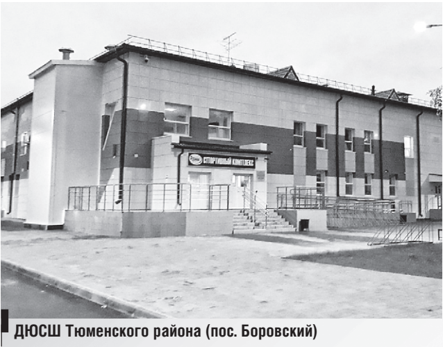
ДЮСШ Тюменского района (пос. Боровский)