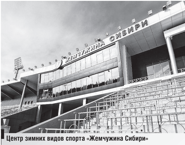
Центр зимних видов спорта «Жемчужина Сибири»