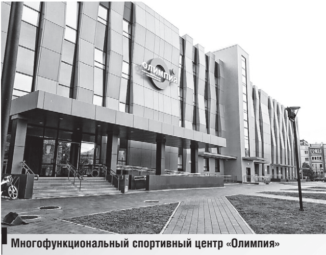
Многофункциональный спортивный центр «Олимпия»