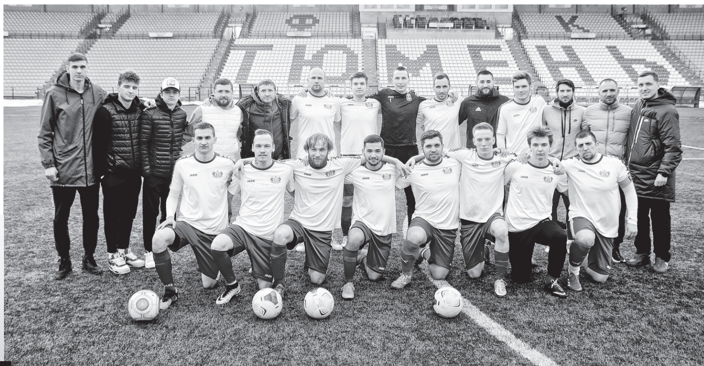
Тюменская команда «Газпромбанк»

Пришлось организаторам группового этапа в Тюмени срочно искать команды, которые бы заменили отказников. Вне зачёта была заявлена молодёжная местная дружина «Геолог» (за неё выступали юноши 2006 года рож-