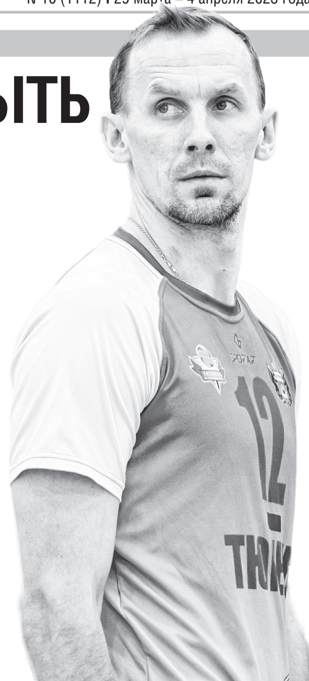
ВОЛЕЙБОЛ. ЧЕМПИОНАТ РОССИИ. МУЖЧИНЫ. ВЫСШАЯ ЛИГА «А». ФИНАЛ ЗА 1-8-е МЕСТА. ТАБЛИЦА ПОСЛЕ 6-го ТУРА