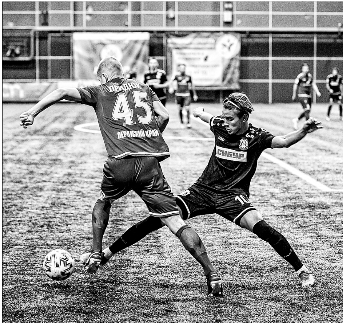
Фрагмент матча «Звезда» — «Тюмень».