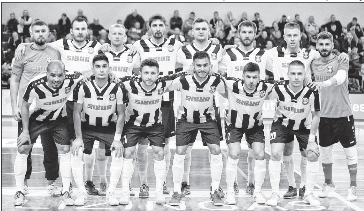
МФК «Тюмень» в Лиге чемпионов.

В матче с «Тюменью» литовцам отступать было некуда, им нужна была только победа. Второй год подряд хозяева «Витиса» делают серьезную ставку на Лигу чемпионов. По сути это единственный в Литве профессиональный футзальный клуб. Выступает он на внутрен-