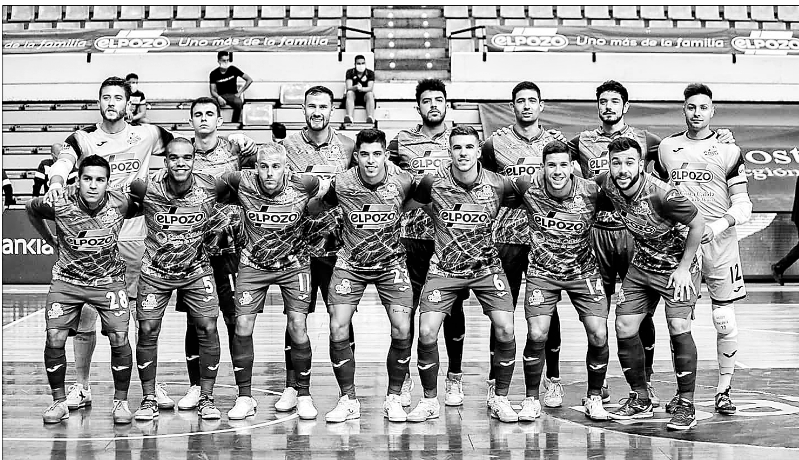
Испанская команда «Эль-Посо» (Мурсия).