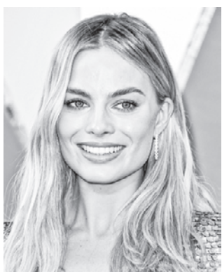
Марго РОББИ актриса (Австралия)