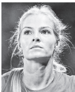
Дарья КЛИШИНА легкоатлетка (Россия)