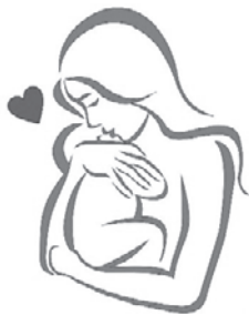
СЕМЕЙНЫЙ КЛУБ «ОСОБАЯ МАМА»

Но у нас была история, когда одна из наших девочек