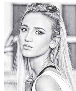
Ольга БУЗОВА певица (Россия)