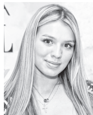
Люся ЧЕБОТИНА певица (Россия)