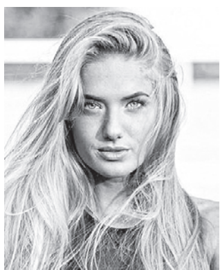
Алиса ШМИДТ легкоатлетка (Германия)