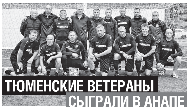
ТЮМЕНСКИЕ ВЕТЕРАНЫ СЫГРАЛИ В АНАПЕ