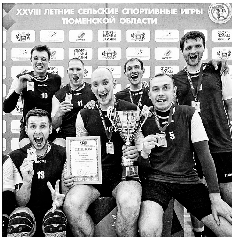
Радость победы волейболистов Ишимского района.

Само собой, соревнования не обошлись без игровых видов спорта. Волейболисты сыграли в столице региона. В соревнованиях представителей сильной половины человечества победу праздновали представители Ишимского района. В решающем матче они ока-