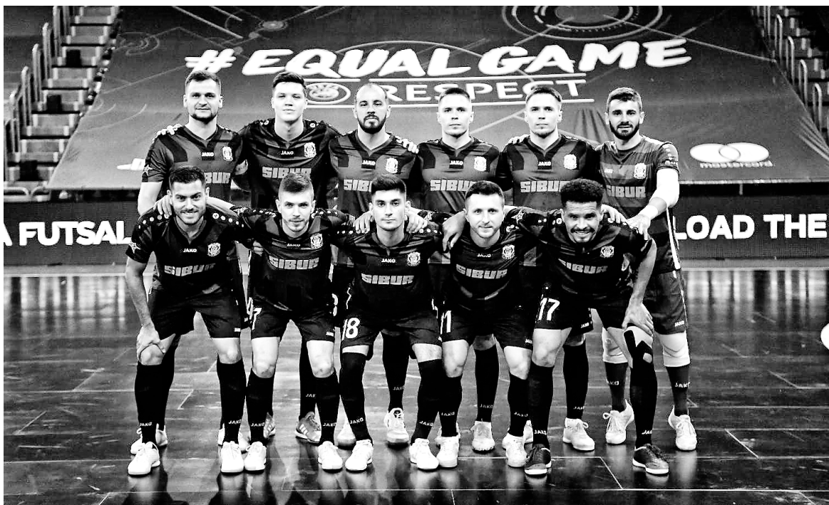
Мини-футбольный клуб «Тюмень».

финале совсем ничем не удивил. Это вовсе не такая грозная команда. Если бы позволяли кадры, то счёт, уверен, был бы в нашу пользу.