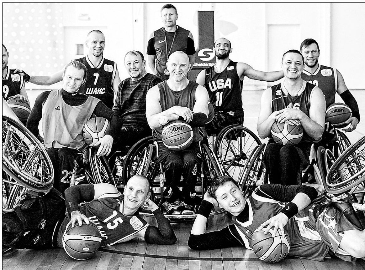
Тюменская команда «Шанс».

Виталий БОРИСОВ, АСН «Тюменская арена».