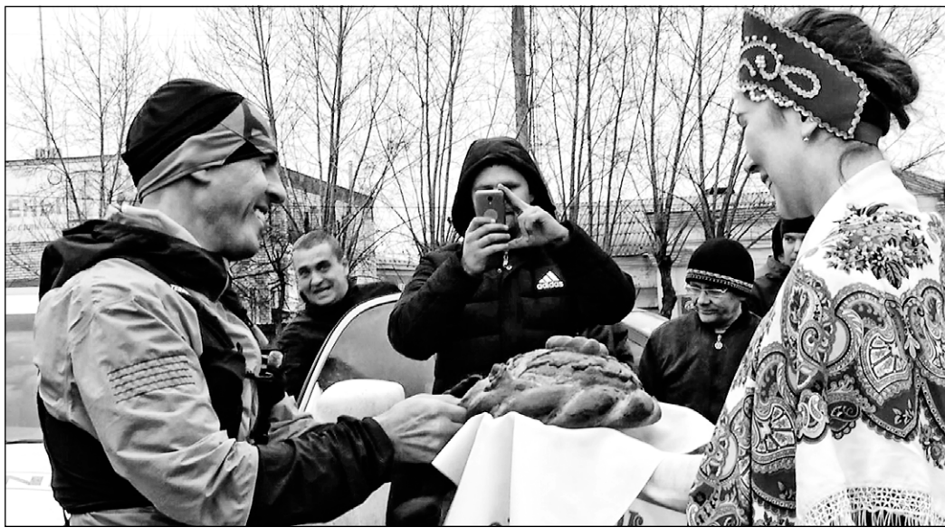
Хлеб-соль на финише